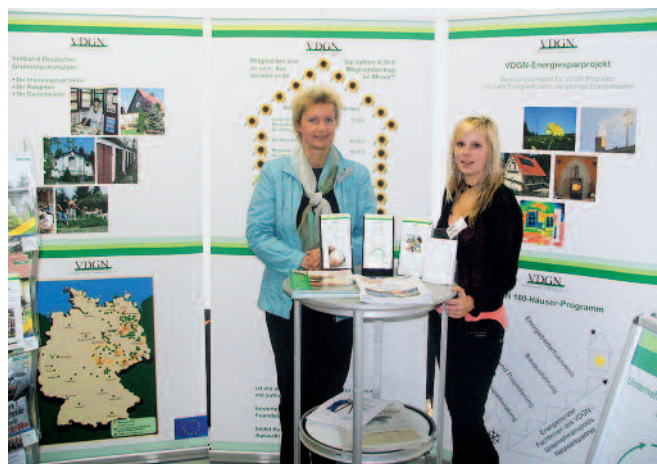
Der Förderverein ist auf vielen Messen präsent

Die Vereinstätigkeit ist vornehmlich darauf gerichtet, klein- und mittelständische Unternehmen auf vielfältige Weise zu unterstützen, den Erfahrungsaustausch untereinander zu fördern und die Entwicklung ihres Qualitätsmanagements zu begleiten.