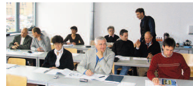
Mit Weiterbildung auf der Höhe der Zeit