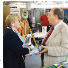
Im Gespräch mit Interessenten